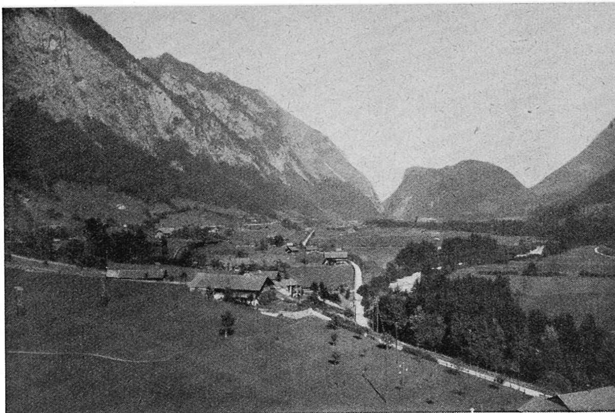
Abb. 2. Der Abschluß des Simmentals aus SW. Simmenfluh—Port—Burgfluh—Niesenfuß

Sie weist folgende Vorkommen auf (Numerierung nach Abb. 4): Ringoldingen (Metschenmatte, 3), Steinischuttkegel bei Erlenbach (4), «im Schlatt» (5), beim «Kastel» (6), Latterbach («auf der Nagelfluh», bis «im Drittel», 9), Station Oey (7), in der Port (11). Dazu finden sich noch die weitem Vorkommen: Ringoldingen (Zelg, 1), Mühleboden (2), Erlenbach (Kleindorf, ohne Nummer), 200 m S Oey (linkes Kirelufer, ohne Nummer), E Oeyfeld (8) und S Burgholz (10). Bei Zelg (1) bestehen die verfestigten Schotter zum Teil aus groben, bis 1 m 3 großen Blöcken. Sie verraten uns die damalige Gletschnähe. Die Partie «im Schlatt» (5) wurde bei einer Wegverbreiterung im Winter 1922/23 zum größten Teil, in der Port (11) aus dem gleichen Grunde im Jahre 1939 vollständig weggesprengt.