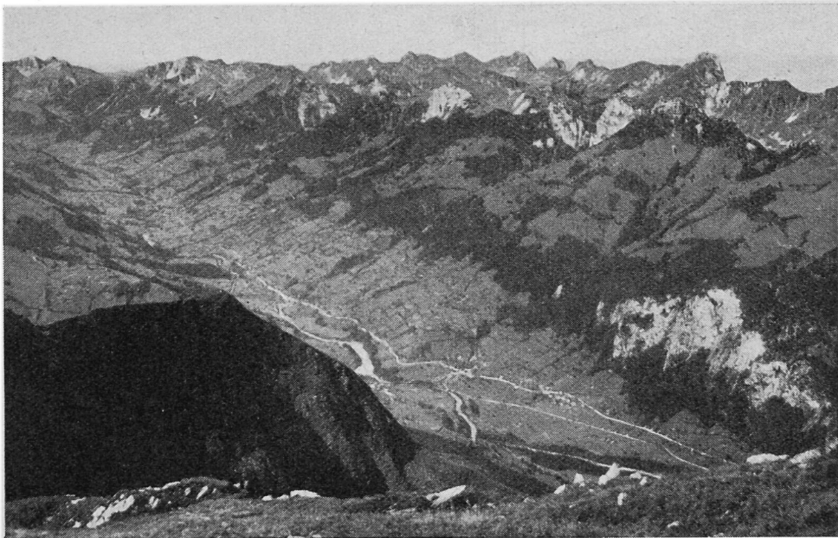
Abb. 1. Das Niedersimmental von Oberwil bis Außerlatterbach. Käufliche Ansichtskarte