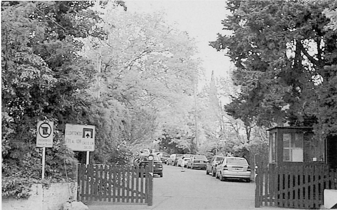
Foto 1: Immer mehr Wohngebiete der Oberschicht werden – oftmals illegal – nachträglich abgesperrt.

More and more neighbourhoods of the upper classes are enclosed – in most cases illegally.