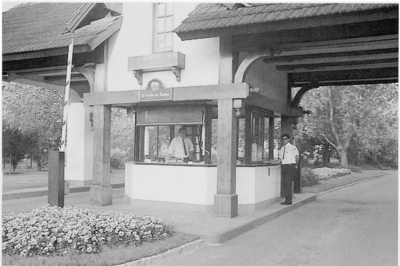
Foto 2: Repräsentative Einfahrten charakterisieren den Status von Country Clubs der oberen Mittelschicht.

Representative entrance gates characterize the status of upper middle class Country Clubs.